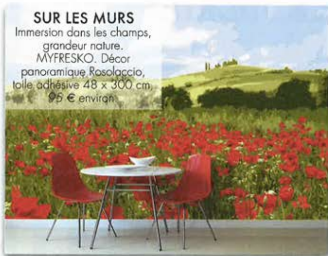
SUR LES MURS Immersion dans les champs, grandeur nature. MYFRESKO. Décor panoramique Rosolaccio, toile adhésive 48 x 300 cm, 95 € environ.