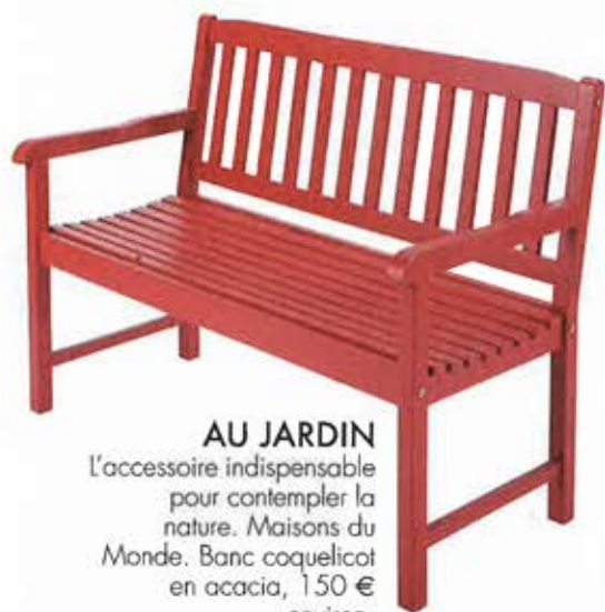
AU JARDIN L'accessoire indispensable pour contempler la nature. Maisons du Monde. Banc coquelicot en acacia, 150 € environ.